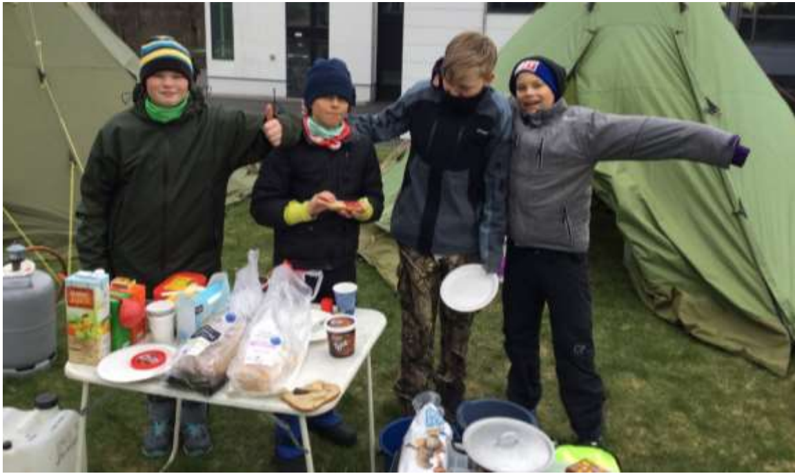
Godt å treffe gode vener i speidaren!