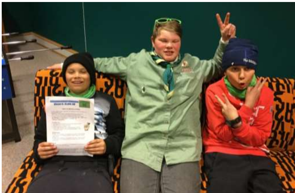
Tre vandrarar gler seg til landsleiren på Hell.

Joleavslutning på Heimen i Bykle, tysdag 12. desember, der vi las tekster og song nokre jolesongar saman med Bykle songlag. Før dette var det speidaradventssamling med gløgg og joleknask der vi snakka om programmet og landsleiren vår/sommar 2018.