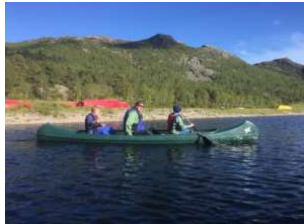
Litt undervisning før kanopadling til øya i Hartevatn, Hovden.