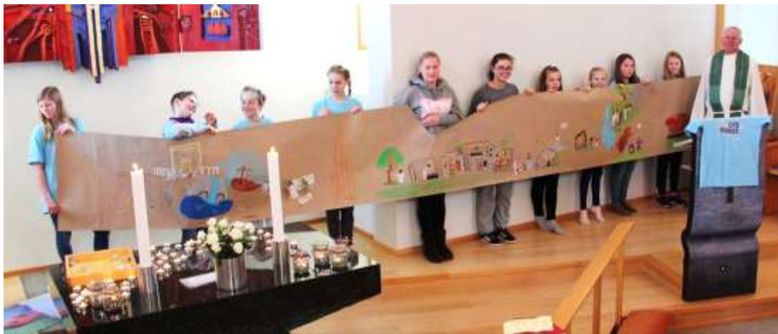
Lys Vaken i Bykle kyrkje

Både Tårnagentar og Lys Vaken vil bli arrangert annakvart år med to årstrinn. Det er for å få fleire med på arrangementa av gongen.