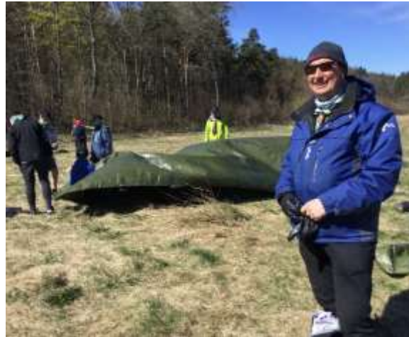
Leiarane fungerer som domarar/byggje gapahuk

Årsavslutning ved Hegni onsdag 14.juni, der vi lånte kanoar frå Hovden fjellstoge. Då var vi på kanotur til ei øy i Hartevatn der vi hadde bålkonkurranse, og sjokoladebanan og marsmellows på bål. Vi var 8 på tur, også to roverar som var heime på sommarferie.