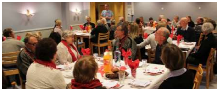
Middagsfelleskap i kyrkjekeddaren i Bykle, med dansk julefrukost.

Prostidiakonen gjer eit viktig arbeid i møte med menneske i ulike livssituasjonar. Årsrapport frå diakonen er vedlagt. Det har vore ein sjømannskyrkjekveld i Fjellgardane kyrkje. Det var diakonigudsteneste 7.mai i Fjellgardane kyrkje. Diakonen har hatt 14 besøk og samtaler i Bykle sokn, totalt 156 i prostiet. Ho er saman med frivillige involvert i Middagsfelleskap i Bykle kyrkje, som er eit ope middagsfelleskap for alle, og ei ope Lev Vel-gruppe med 8 samlingar (gåtur og prat).