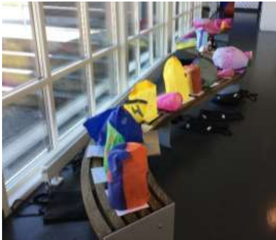
Varmluftsbiljongar klare til døming.