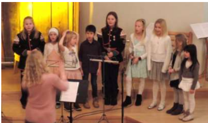
Bykle og Fjellgardane barnekor