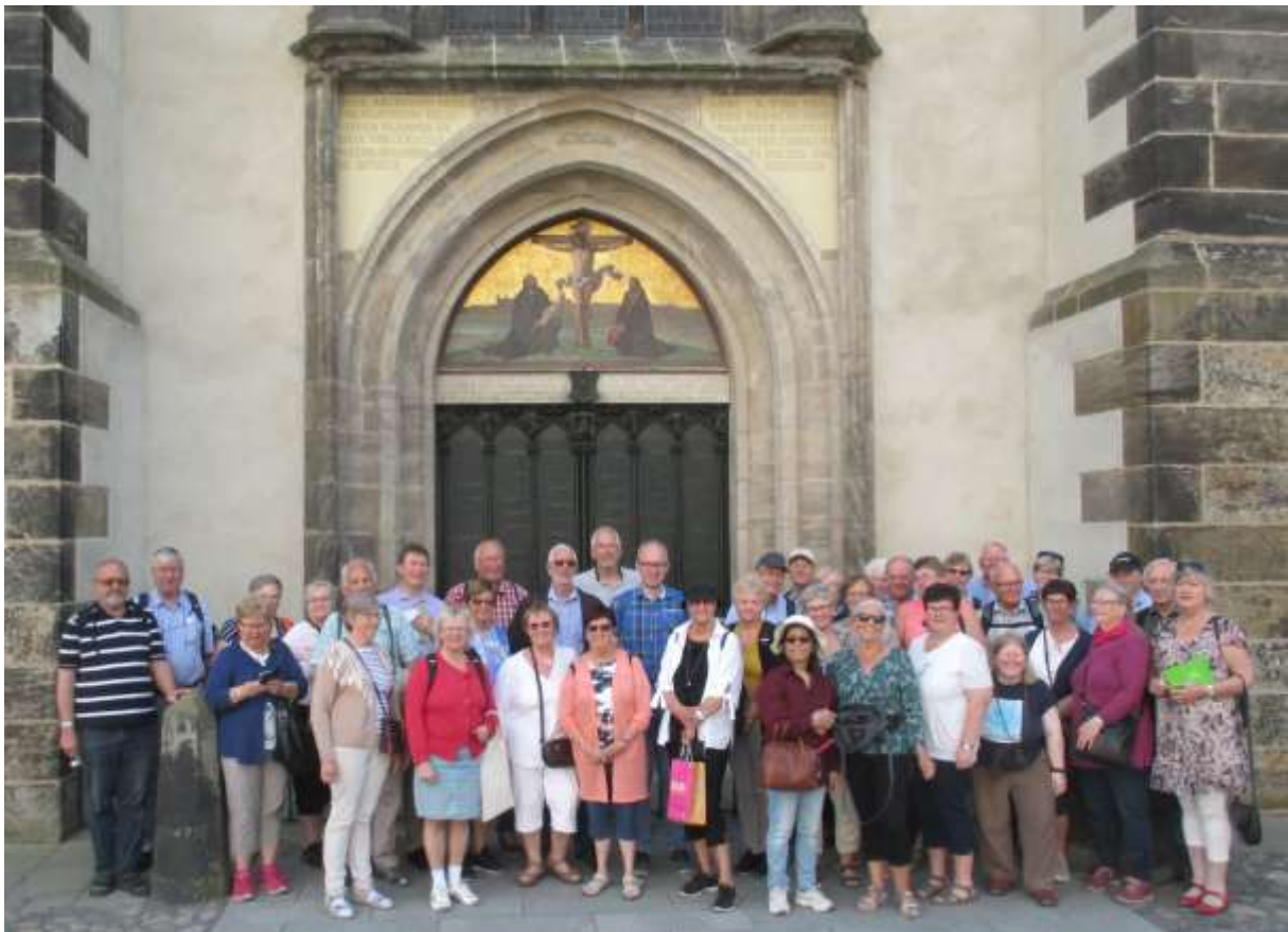
Turdeltakarane samla framom kyrkjedøra i Wittenberg der Martin Luther slo opp dei 95 tesene mot paven.